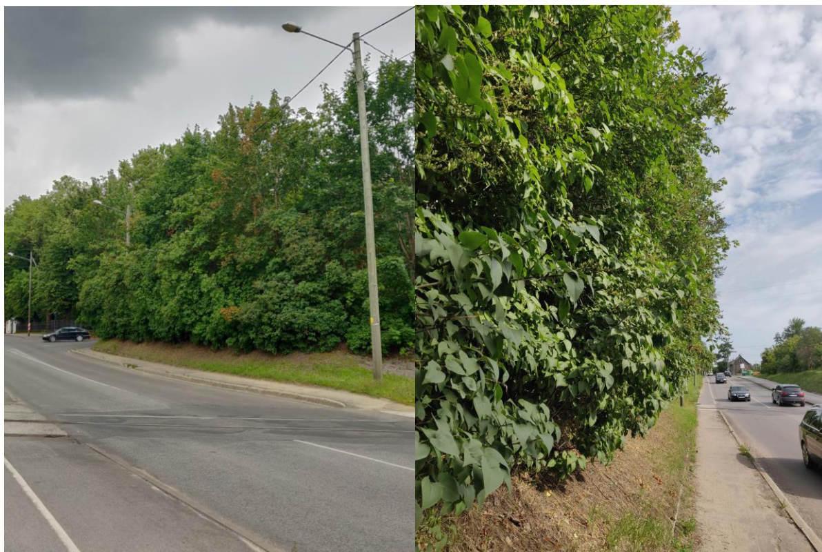
Foto 4. Planeeringuala ida poolne külg tiheda sireli hekiga.

Võru tänavalt külgneb planeeringuala tiheda sireli hekiga (foto 4). Kavandatava hoone rajamiseks ning sinna viiva kõnnitee loomiseks tuleb tihe hekk maha võtta ning tänu sellele suureneb vaatekoridor Pauluse surnuaiale ja monumendile.