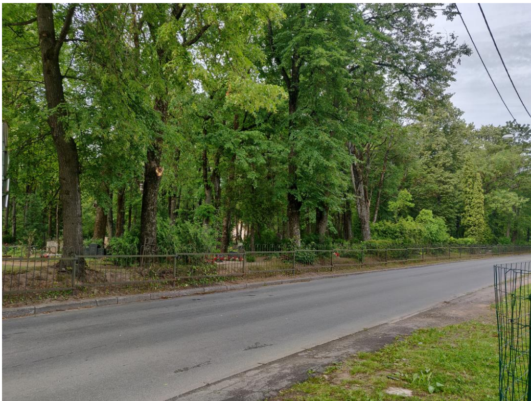
Foto 2. Vaade planeeringualalt Pauluse surnuaiale.

Planeeringuala lõunapoolsel küljel asub Pauluse kalmistu (foto 2), mille 50 meetrine kaitsevöönd ulatub planeeringualale. Samuti ulatub alale Vabadussõja mälestussamba (foto 3) 50 meetrine kaitsevöönd.