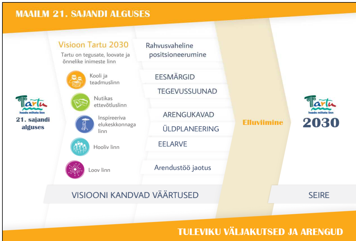
Joonis 1. Tartu strateegilise arendamise mudel