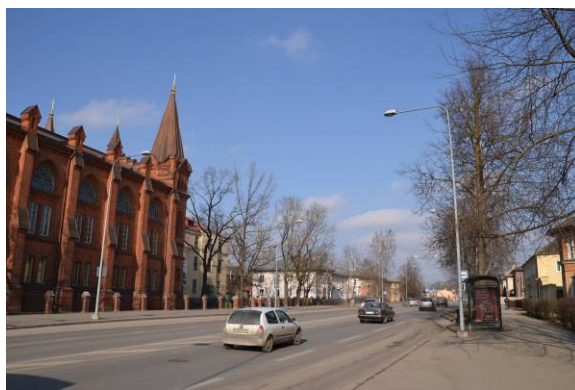
Foto 3. Vaade Peetri tänavale. Autor: Kadri Kattai Foto 4. Vaade Narva mnt-le. Autor: Kadri Kattai

Lõuna suunda jäävad kahekorruselised kortermajad ning kahe-suunaline Puiestee tänav (Foto 5), mis on planeeringualaga külgneval lõigul kolme sõidurajaga. Puiestee tänava üldlaius on ca 18,2 m, sellest sõidutee osa on ca 8,3 m ning kõnniteede laiused neli meetrit ja 5,8 m.