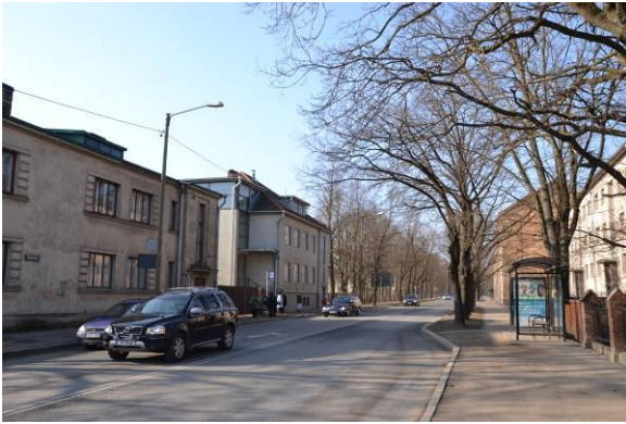
Foto 5. Vaade Puiestee tänavale.