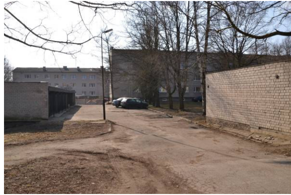
Foto 6. Vaade ala naabrusesse läänes.