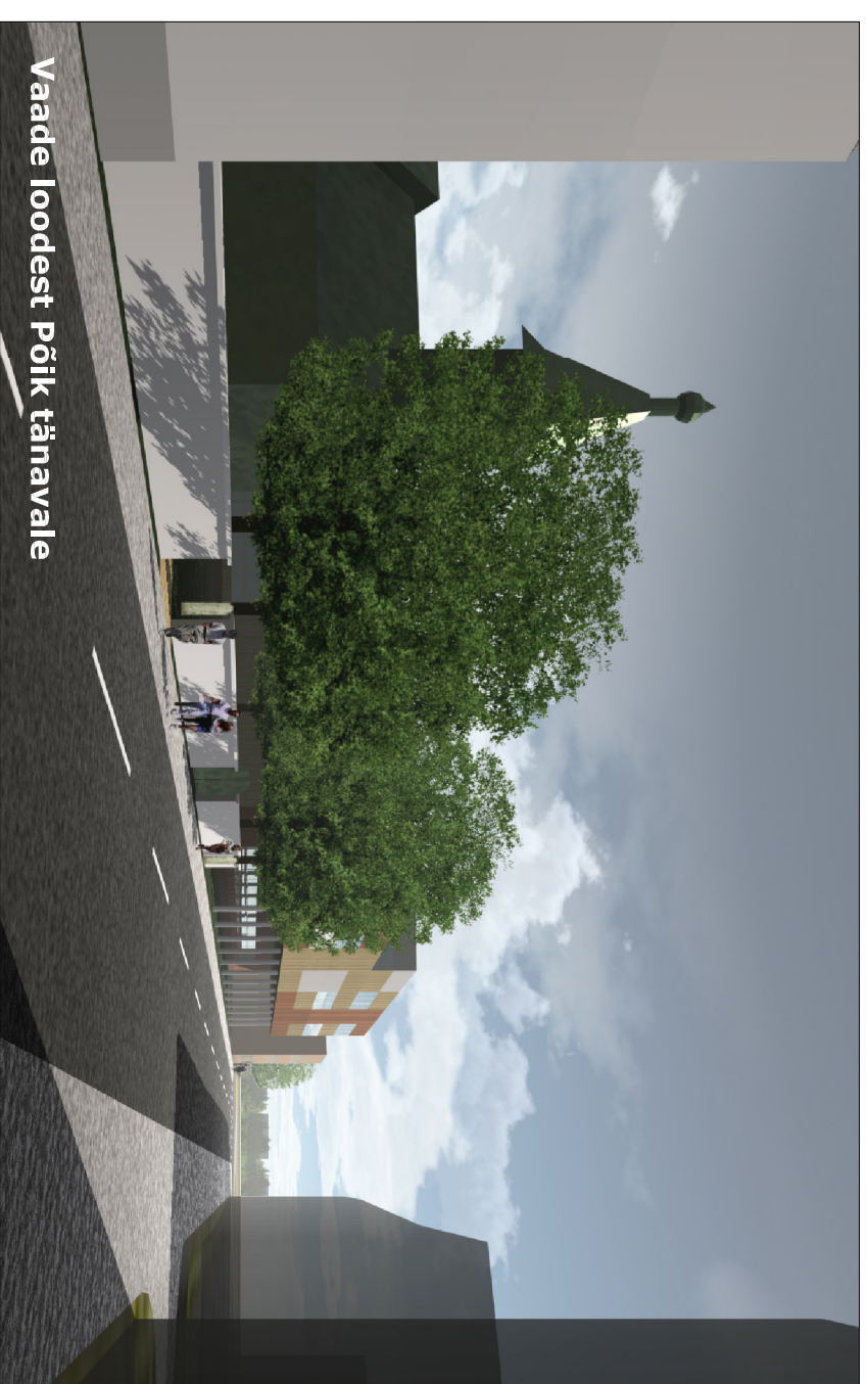
Vaade loodest Põik tänavale