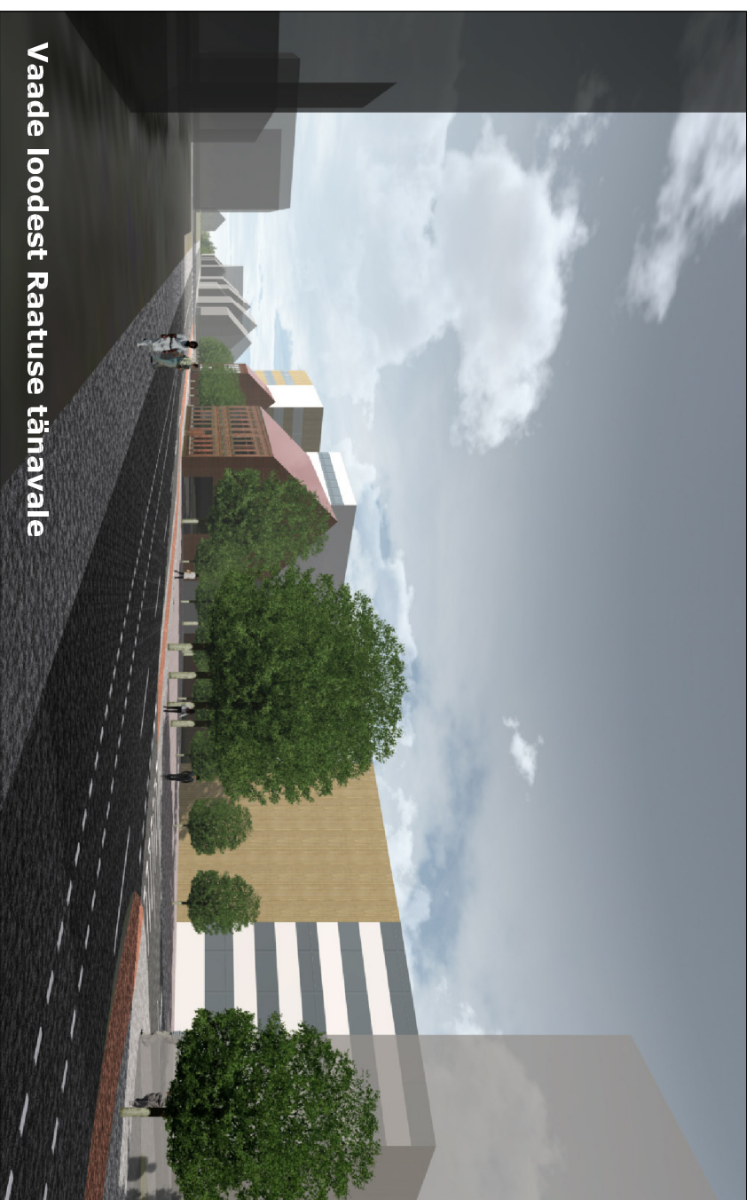
Vaade loodest Raatuse tänavale