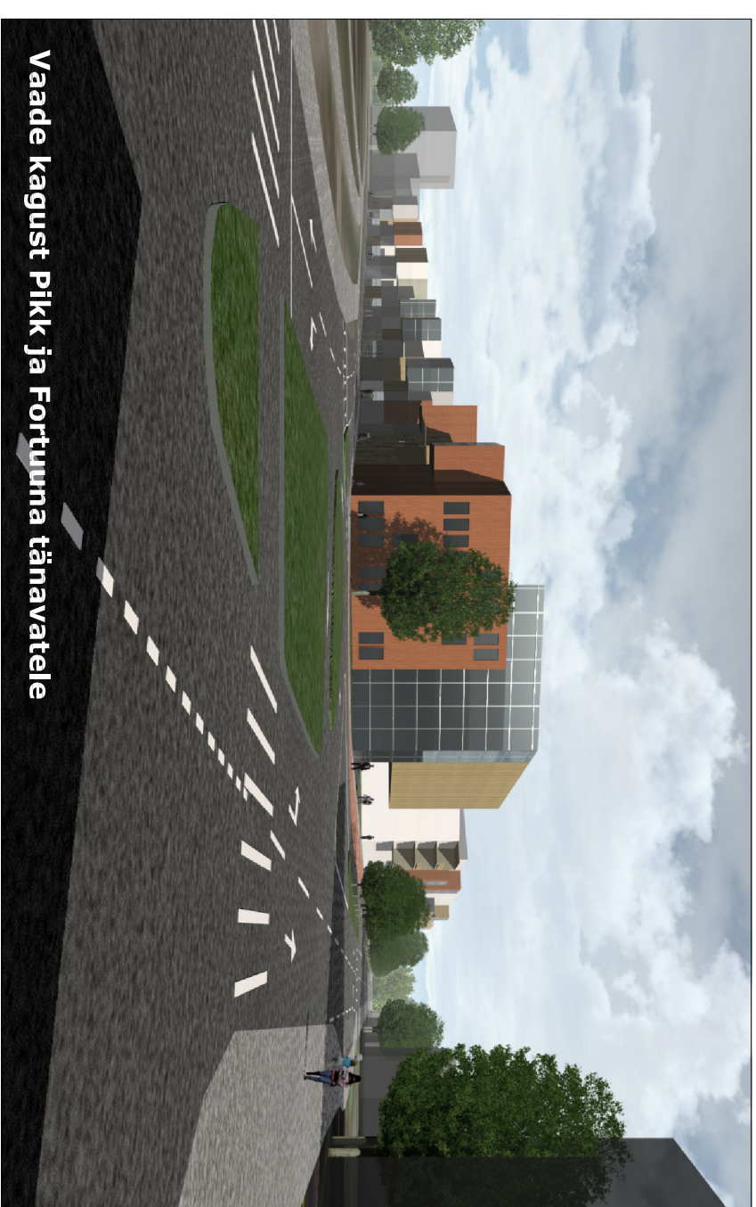
Vaade kagust Pikk ja Fortuuna tänavatele