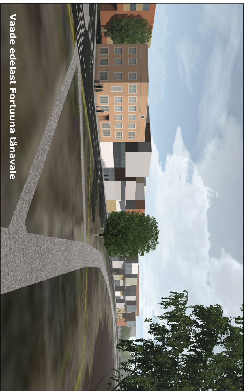
Vaade edelast Fortuuna tänavale